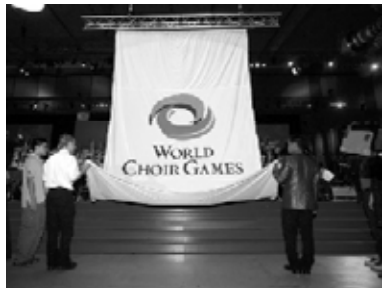
Die olympische Flagge wird gehisst.

Insgesamt trafen sich in den zehn Tagen 441 Chöre mit über 20.000 Sängerinnen und Sängern aus 93 Nationen zum weltweit größten