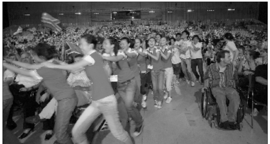
Ausgelassene Stimmung in der Grazer Stadthalle. Mehrere Großveranstaltungen fanden hier statt. Wir erlebten „The Choral Fireworks“ und die große Abschlussveranstaltung, in der sich alle Olympiasieger vorstellten.