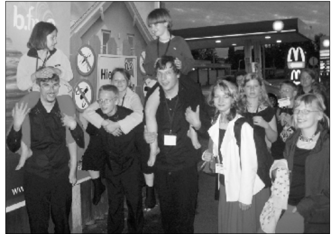
Müde und gut gelaunt ging es spät ins Hotel.

bei war der olympische Geist, „Dabei sein ist alles“, jederzeit zu spüren. Es war für unseren Bannewitzer Chor eine Ehre und Auszeichnung, zu diesem Weltereignis eingeladen zu werden. Wir durften zwei öffentliche Konzerte ausgestalten, das erste im wunderschönen Landhausinnenhof, bei einsetzendem