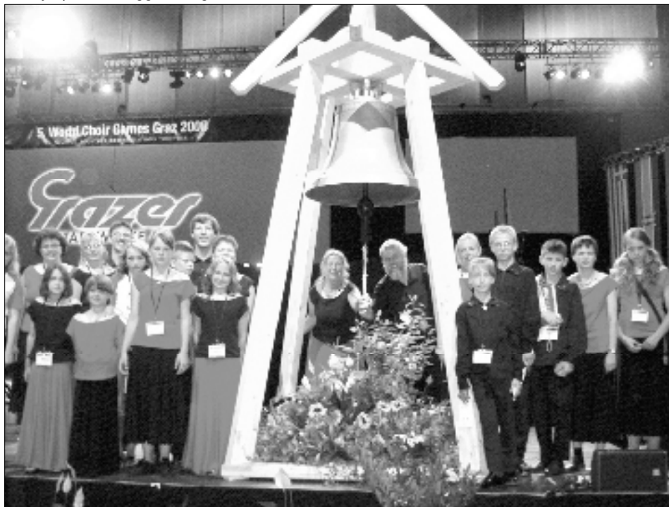
Unser Chor an der großen Glocke der Chor-Olympiade in der Stadthalle.

Nieselregen, das zweite auf der Murinsel. Neben den großartigen Konzerten in der riesigen Konzert- und Messehalle sangen wir bei jeder Gelegenheit, erlebten eine Stadtführung, hatten Spaß im Erlebnisbad, vergnügten uns beim Einkaufsbummel. Unvergessen für viele Kinder waren auch Frühstücksbüffet und Hotelübernachtung.